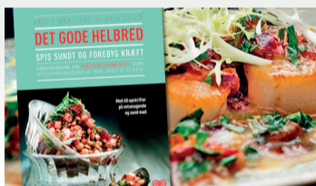
Smid julesulet Inspiration og bøger