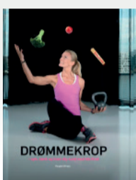
Drømmekrop Ida Krak