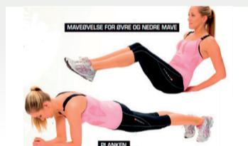
Vi træner Arrangement