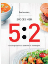
Succes med 5:2 Åsa Swanberg