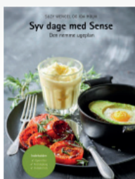
Syv dage med Sense Suzy Wengel (..)